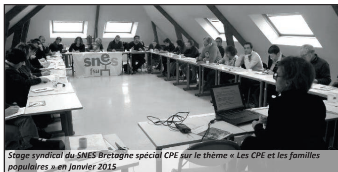
Stage syndical du SNES Bretagne spécial CPE sur le thème « Les CPE et les familles populaires » en janvier 2015

Accéder à ce travail réel permet de ré-ouvrir d'autres possibles, de discuter d'autres manières de faire et de fournir à tous une palette enrichie de manières de se sortir de la situation.