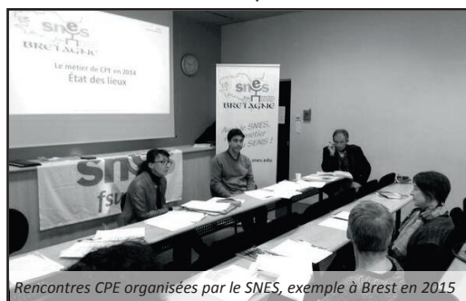
Rencontres CPE organisées par le SNES, exemple à Brest en 2015

Nous puisons une part importante de nos ressources professionnelles auprès de ceux qui font le même métier que nous. Face à ces nouvelles prescriptions, comment faire ? Qu'en disent les collègues ? Comment s'y prennent-ils ? C'est de la discussion entre pairs, du même métier que se forge le « genre du métier ». Ce qui fait qu'on se sent du même métier, ce sont aussi toutes les manières de faire, de dire, de sentir ce qui est adapté ou non dans la situation. Ce sont des règles non écrites qui se construisent et se sédimentent dans l'histoire du métier. Pour que le « genre » soit une ressource, il faut qu'il soit vivant. Quand il n'est pas suffisamment entretenu par des discussions de métier, quand il ne joue plus son rôle chacun se retrouve seul et s'épuise à trouver des manières de réagir, soit en refusant de faire ce qui est à faire, en s'exposant (transgression), soit en renonçant à