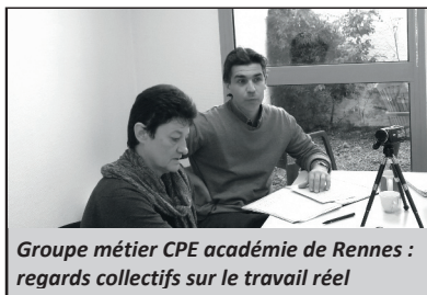
Groupe métier CPE académie de Rennes : regards collectifs sur le travail réel

roger la manière dont les éléments d'un dilemme s'opposent : une réalité professionnelle fait ressortir ses propres contradictions et la discussion fait apparaître la manière dont chacun cherche à les dépasser. Ici, la démarche d'éducation à l'autonomie est entravée par la complexité de ses propres enjeux : il ne suffit pas de vouloir la mettre en œuvre, il faut la faire vivre face aux intérêts divergents des acteurs concernés (élèves, surveillants, agents, professeurs, direction, parents...). La nécessité de poser des règles n'est pas un obstacle pour