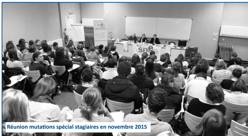
Réunion mutations spécial stagiaires en novembre 2015