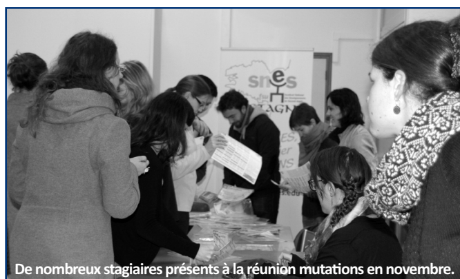
De nombreux stagiaires présents à la réunion mutations en novembre.