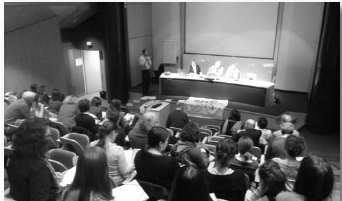
Stage histoire de l'art en Mai