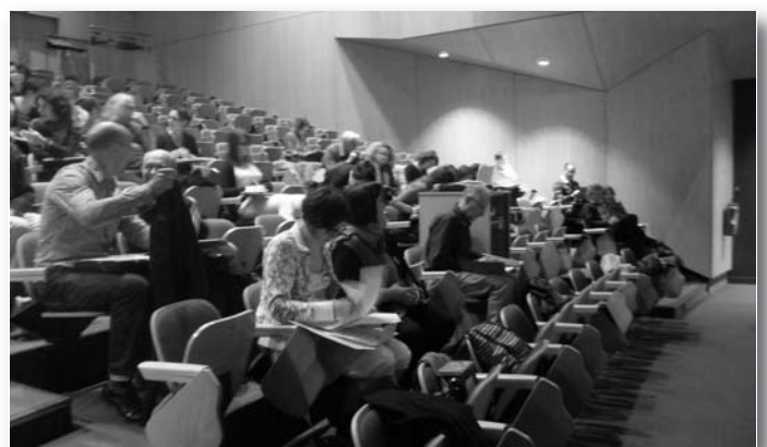
Stage les ados qui sont dans nos classes en novembre

La FSU organisera avec le SNUIPP (syndicat du 1er degré) et le SNES, un stage :