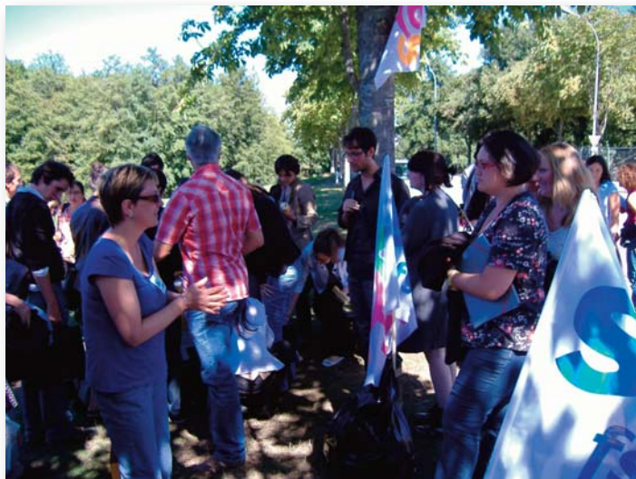
Pique-nique d'accueil des stagiaires par le SNES à Cesson le 31 Août 2010.